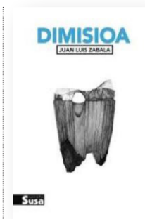
'DIMISIOA' Egilea: Juan Luis Zabala. Argitaletxea: Susa.

Zientzia fikzioa tradizio luzeko generoa da, gureaz bestelako munduak imajinatzea, etorkizun posibleei buruz gogoetatzea duena ardatz. Horretarako, ekintza espazio-denborazko koorde-