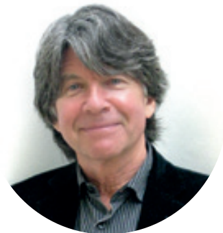
RANDOM HOUSE CHILDREN'S BOOKS