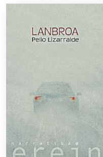
'LANBROA' Idazlea: Pello Lizarralde. Argitaletxea: Erein.

Bi ahotsek txirikordatzen dute nobela honek dakarkigun istorioa. Bata, borroka armatuko kidea, une batetik bestera mendian gora ihes egin beharko duena. Bestea, bailara bakartu samar bateko medikua, herriz herri kontsulta pasatzen duena, iheslariak bere autoa geratu